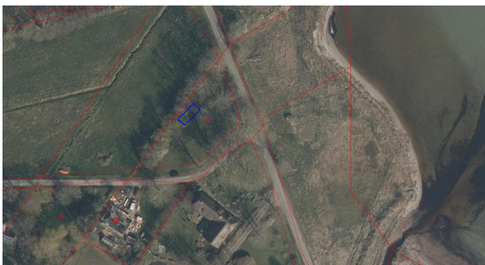
Matriklen om placeringsområde (blå)