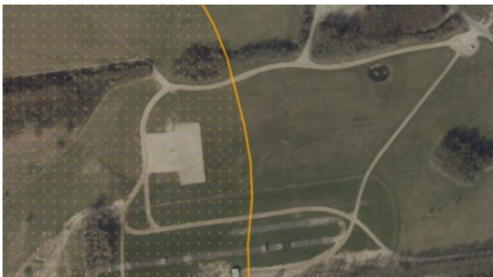
Luftfoto af området. Indsat fra SagsGIS. Det strandbeskyttede areal er markeret med gul.

Autocamperne ønskes placeret i afmærkede båse i en række langs områdets forsyningsvej ”Takten” samt på selve den befæstede sceneplads.