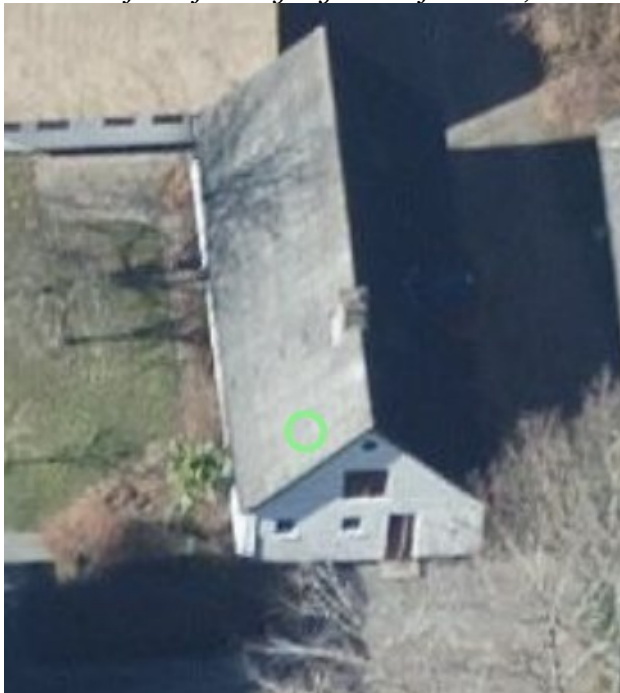
2019, skråfoto af staldens østlige side