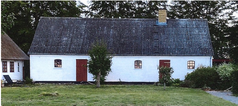
Medsendt foto af den sydlige side af stalden, som vender mod vandet