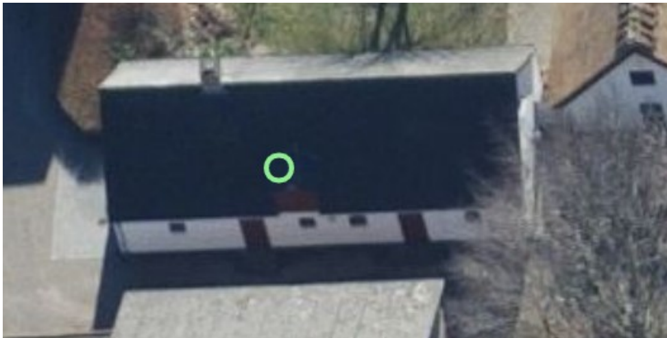
2019, skråfoto af staldens nordlige side. Den tidligere karnap/hølem ses ved markeringen