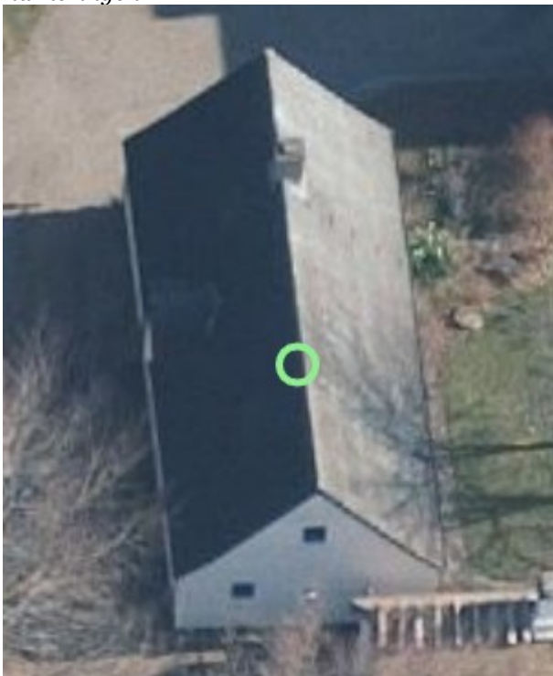
2019, skråfoto af staldens vestlige side