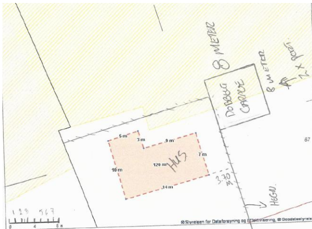
Ansøgt placering af garagen