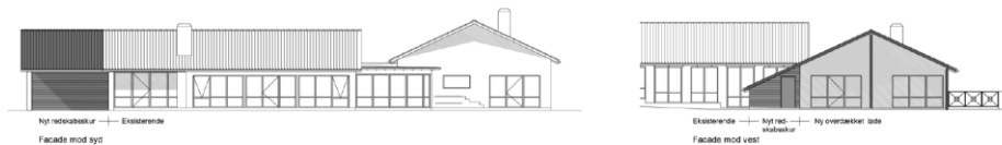
Figur 3, facadetegninger, fra ansøgning