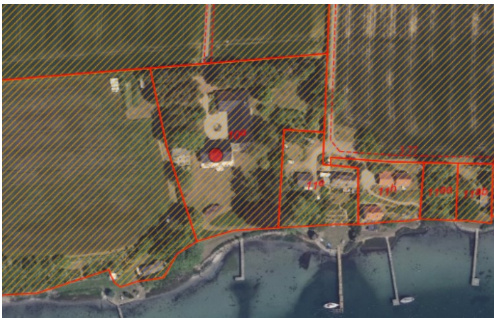
Figur 1. Ortofoto 2020. Det orange skraverede område markerer det strandbeskyttede areal. De umatrikulerede arealer ud til kysten samt stranden er dog også omfattet af bestemmelserne om strandbeskyttelse. De røde streger markerer de vejledende matrikelskel. Ejendommen er vist med rød prik.

Ejendommen matr. nr. 10a, Thurø By, Thurø er i BBR noteret som beboelsesejendom i landzone. Ejendommen ligger ned til Thurø Bund som en af en samling ejendomme, med bebyggelse helt ned til kysten indenfor den oprindelige 100 m strandbeskyttelseslinje. Ejendommen er på 6.593 m 2 og er et nedlagt landbrug. I henhold til BBR er ejendommen bebygget med en bolig på 516 m 2 , hvoraf 345 m 2 er boligareal og 171 m 2 er indbygget udhus. Der er endvidere noteret 30 m 2 overdækket terrasse. Herudover er der en lade på 77 m 2 opført i 1900 og noteret som hestestald. Boligen ligger omtrent 40 m fra kysten med udhusbebyggelsen bag og ved siden af.