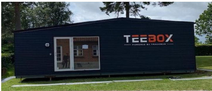
Fig. 2. Fremsendt billedmateriale til illustration af ønsket pavillon.

I har oplyst, at pavillonen kan flyttes med 24 timers varsel, såfremt at det er påkrævet, idet den er konstrueret således, at det er muligt at opføre den på midlertidige punktfundamenter. Pavillonen kræver kun ét strømstik for at fungere. Konceptet er således plug'n'play.