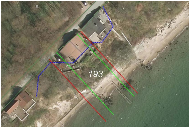
Grøn/eksisterende skel – rød/ansøgte nye skel blå/strandbeskyttelseslinjen

Ejendommen er omfattet af fredskov samt fortidsmindebeskyttelseslinjen.