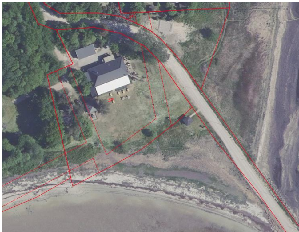
Tilbygningen placeres ved rød pil (under)