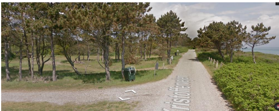
Området ved 34B