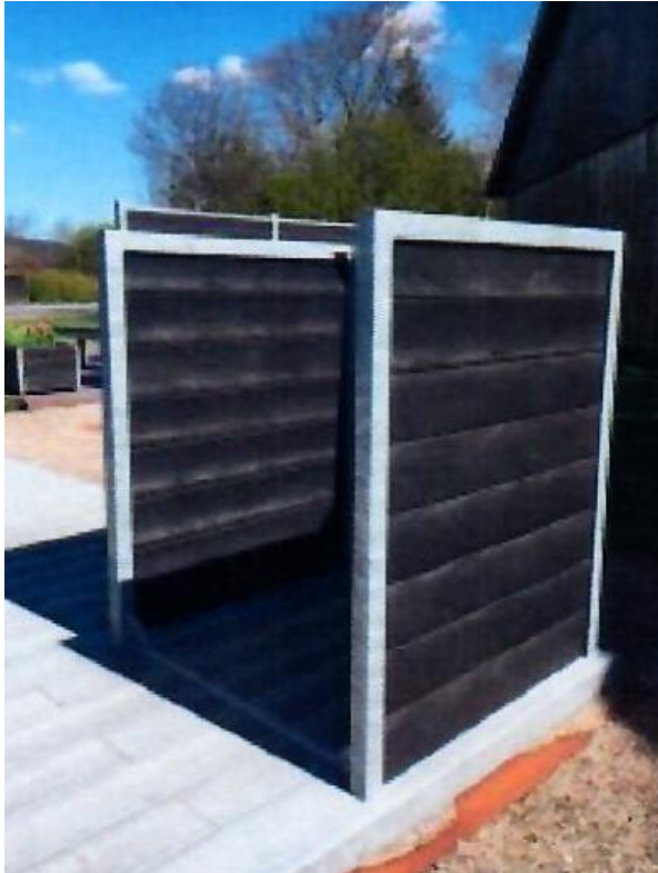
Eksempel på værn som ønskes opstillet

Der ansøges om opstilling af renovationsværn med en højde på ca. 1,2 m ved indkørslerne til to sommerhuse, så affaldscontainerne vil være delvist skjult samt skærmet mod vinden så de ikke vælter.