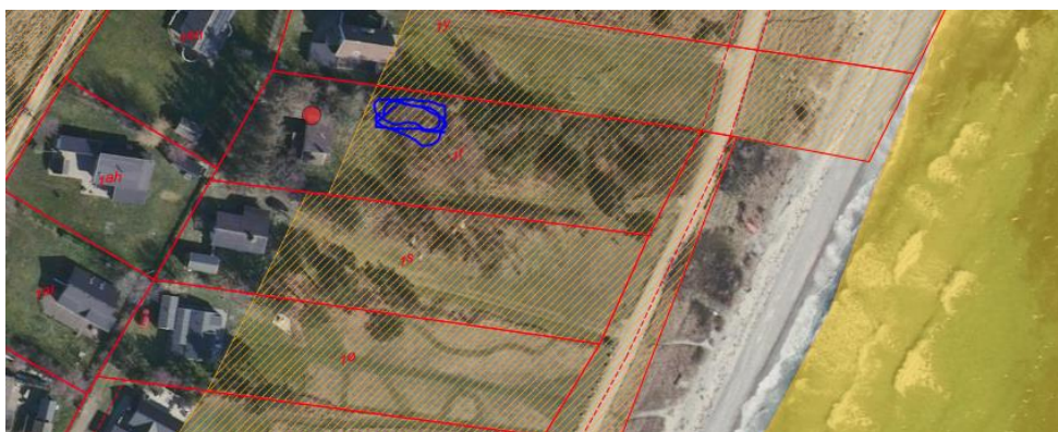
Ejendommen med markering af strandbeskyttelseslinjen og milen/blå)

Der ansøges om at etablere en 80 cm høj mile med en længde på ca. 15 m til et 3-strengt system. Anlægget placeres ca. 100 m fra havet og inden for strandbeskyttelseslinjen.