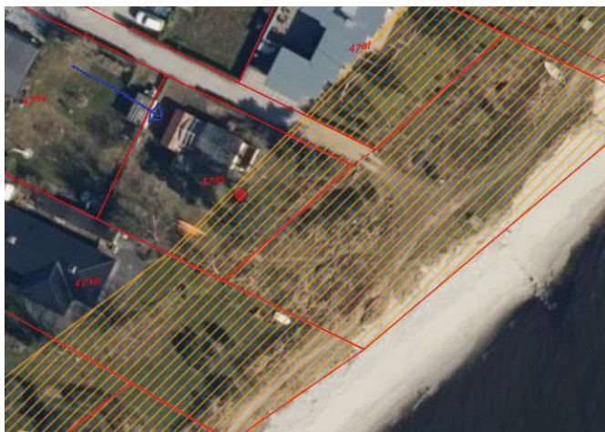
Ejendommen ved blå markering – skraveret strandbeskyttelseslinjen Under placering af faskinen

De geotekniske forhold er rigtigt gode for denne løsning, men såfremt gældende afstandsforhold til såvel skel, vej og bygning skal kunne overholdes kræver dette at der opnås tilladelse til at anbringe en mindre regnvandsfaskine i græsplænen indenfor strandbeskyttelseslinjen. Der er tale om en nedgravet regnvandsfaskine på ca. 5 m 3 .