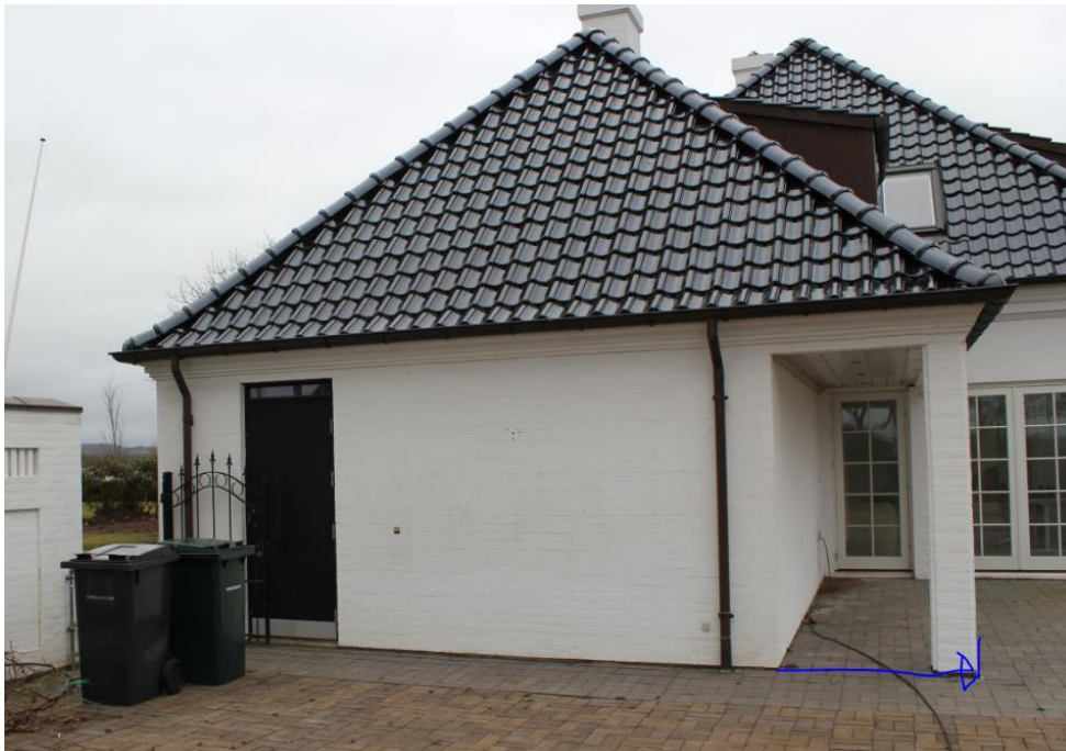
Garagens endevæg rykkes frem som vist med blå pil til søjlernes fremkant

Boligen og hovedparten af landbrugsjorden er omfattet af den udvidede (100-200m) strandbeskyttelseslinje.