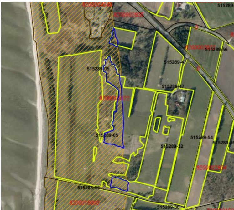
Figur 2, kortbilag fra ansøgningen, der viser de ansøgte arealer indenfor strandbeskyttelseslinjen med blå streger

Kystdirektoratet modtog i marts 2020 en ansøgning på vegne af ejer, om dispensation til at rejse skov på ejendommen, delvist indenfor den udvidede strandbeskyttelseslinje, som led i skovrejsning på ejendommen generelt.