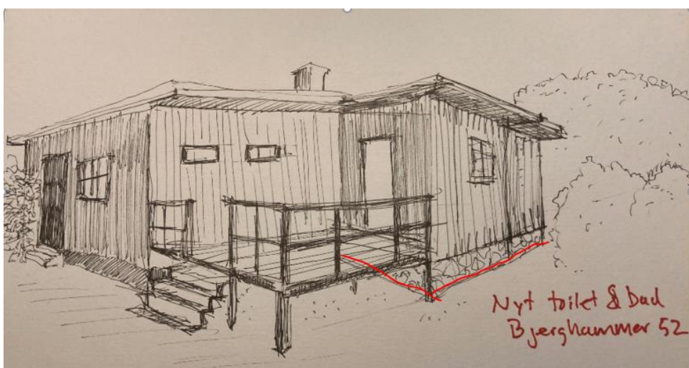
Tilbygningen markeret med rød ved grundmuren