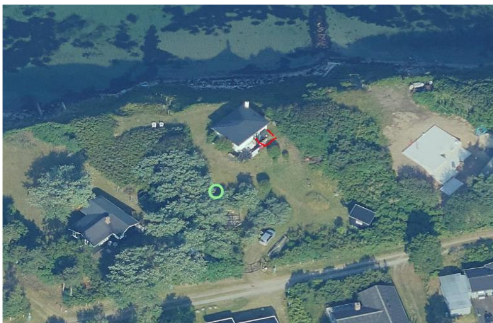
Sommerhuset med rød markering visende princippet for tilbygningen.

Det eksisterende toilet sløjfes og tillægges køkkenarealet.