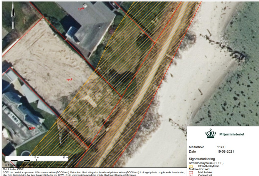
Fig. 1. Ortofoto 2020. Det orange skraverede område markerer det strandbeskyttede areal. De umatrikulerede arealer ud til kysten samt stranden er dog også omfattet af bestemmelserne om strandbeskyttelse. De røde streger markerer de vejledende matrikelskel.

Der er søgt om dispensation til at hæve terrænet i forbindelse med etablering af faskine inden for strandbeskyttelseslinjen på matr. nr. 12ck Vejlbj By, Risskov (fig. 1).