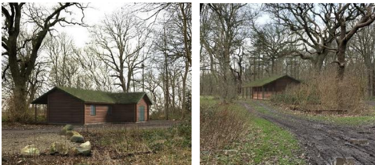
Fig. 4. Visualiseringer af den tidligere ansøgte natur- og friluftshytte. Det bemærkes, at tagkonstruktion ændres ift. det viste på billedet.