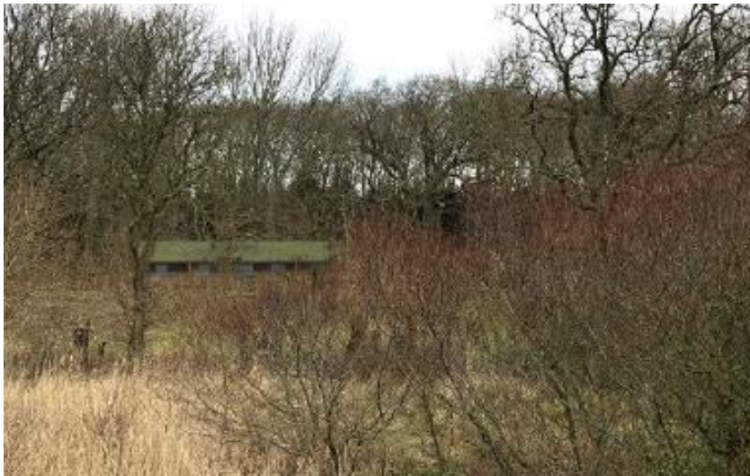
Fig. 5. Visualisering af den ansøgte natur- og friluftshytte. Det bemærkes, at tagkonstruktion ændres ift. det viste på billedet.

Det fremgår af ansøgningen, at byggepladsen vil være ca. 400 m 2 , mens den nærliggende flis- og parkeringsplads vil kunne fungere som materialeplads på ca. 380 m 2 . Der vil ifølge ansøgningen derfor være en minimal påvirkning af eksisterende træer.