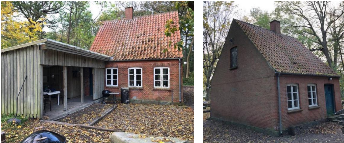
Fig. 2. Billeder fra ansøgningen af den nuværende skovfogedbolig.