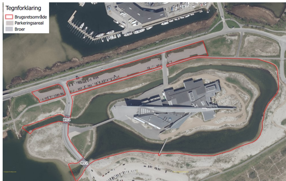
Figur 3, brugsretsområde fremadrettet, fra ansøgningen