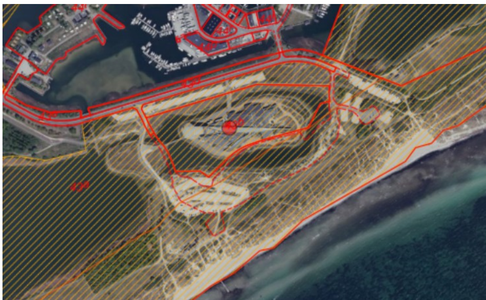
Figur 1. Ortofoto 2020. Det orange skraverede område markerer det strandbeskyttede areal. De røde streger markerer de vejledende matrikelskel. Arken er markeret med rød prik.

Der er indgået en uopsigelig aftale om brugsret over arealet mellem museet og ejendommens ejer, for en periode frem til den 1. juli 2091. Aftalen skal tinglyses på ejendommen. Da brugsretten ikke længere følger den matrikulære grænse mellem matr. nre. 43a og 43b, men udover 43b omfatter en del af 43a, kan aftalen ikke tinglyses for en periode udover 30 år jf. udstykningslovens § 16, stk. 1, nr. 1. Landinspektørfirmaet LE34 har derfor ansøgt Kystdirektoratet om dispensation til at overføre den del af matr. nr. 43a, som museet har brugsret til, til matr. nr. 43b, hvorefter der er sammenfald mellem brugsgrænse og matrikelgrænse, og aftalen kan tinglyses.