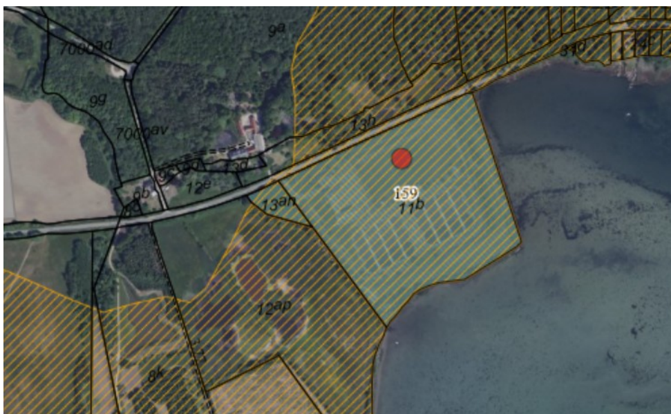
Figur 1. Ortofoto 2020. Det orange skraverede område markerer det strandbeskyttede areal. De sorte streger markerer de vejledende matrikelskel. Den grågrønne flade markerer lokalplanlagt areal. Den røde prik markerer ejendommen.

Ejendommen matr. nr. 13an, Skårup By, Skårup er i BBR noteret som landbrugsejendom, men beliggende i byzone. Ejendommen ejes af Svendborg Kommune. Matr. nr. 11b, Skårup By, Skårup rummer Svendborg centralrenseanlæg – Egsmade Rensningsanlæg og er ejet af Svendborg Spildevand A/S.