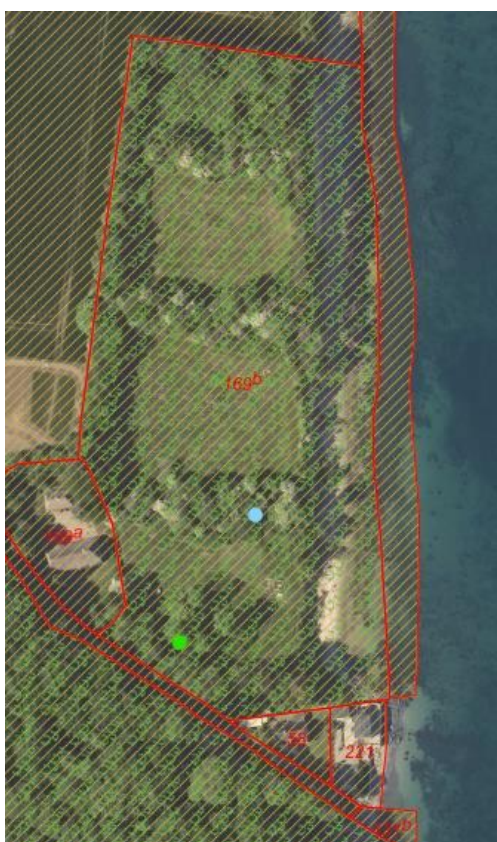
Fig. 1. Ortofoto 2020. Det orange skraverede område markerer det strandbeskyttede areal. De røde streger markerer de vejledende matrikelskel. De grønne buer markerer, at der er tale om fredskov. De gamle toiletters placering er markeret med blå, og den ønskede placering af nye muldtoiletter er markeret med grønt.

Der er anmodet om dispensation til udskiftning af 2 muldtoiletter beliggende på lejrpladsen ved Skeldekobbøl Skov, matr.169b, Skelde, Broager inden for strandbeskyttelseslinjen. I forbindelse med udskiftning af de gamle toiletter ønskes der en anden placering af de nye toiletter, der består af ny toiletbygning med 1 handicaptoilet + 1 almindelig toilet. Der nedgraves en opsamlingsstank.