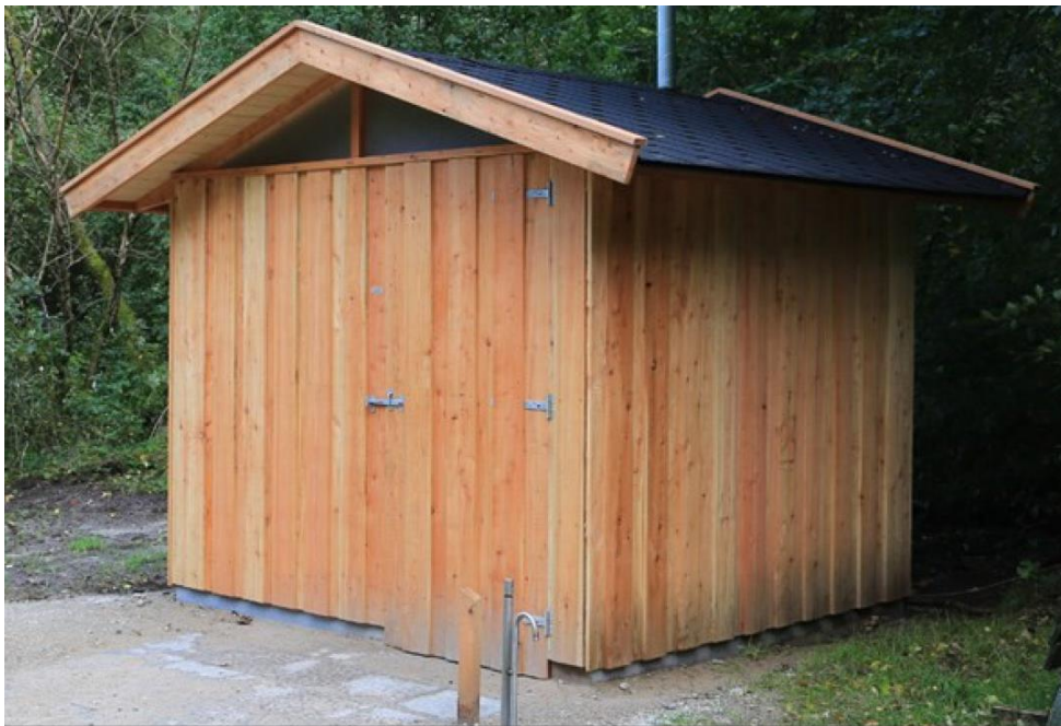
Fig. 4. Medsendt billedmateriale.

Facaden på toiletbygningen vil have en bredder på 4 m og en højde på 3 m. Billedet er fremsendt til illustration af toiletbygningens facade.