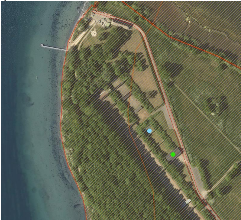
Fig. 1. Ortofoto 2020. Det orange skraverede område markerer det strandbeskyttede areal. Den orange linje markerer den gamle strandbeskyttelseslinje, de røde streger er afgrænsning af matriklen. Skovområdet fra skydebanen og ud mod vandkanten er fredskov. Grøn markering af skydehus og blå markering ved området, der ønskes overdækket.

I har ansøgt om dispensation til overdækning af et eksisterende anlæg på lukket skydebane. Skydebanen er placeret inden for strandbeskyttelseslinjen på ejendommen matr. nr. 198, Kær, Ulkebøl, det oplyses at Sønderborg Kommune er ejer af arealet.