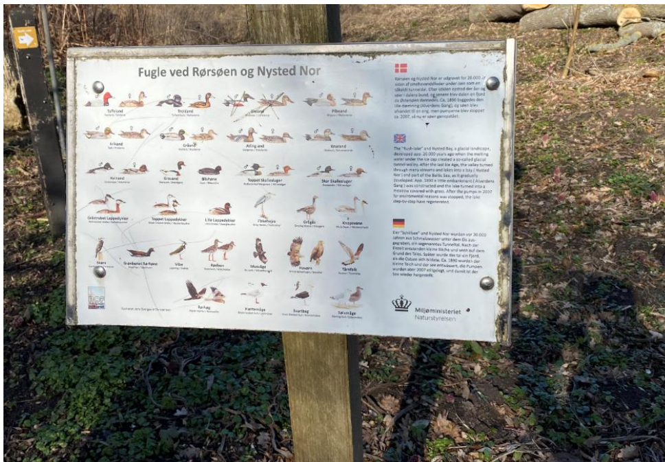
Fig. 3. Fremsendt billedet af en fugletavle til illustration af det påtænkte skilt.