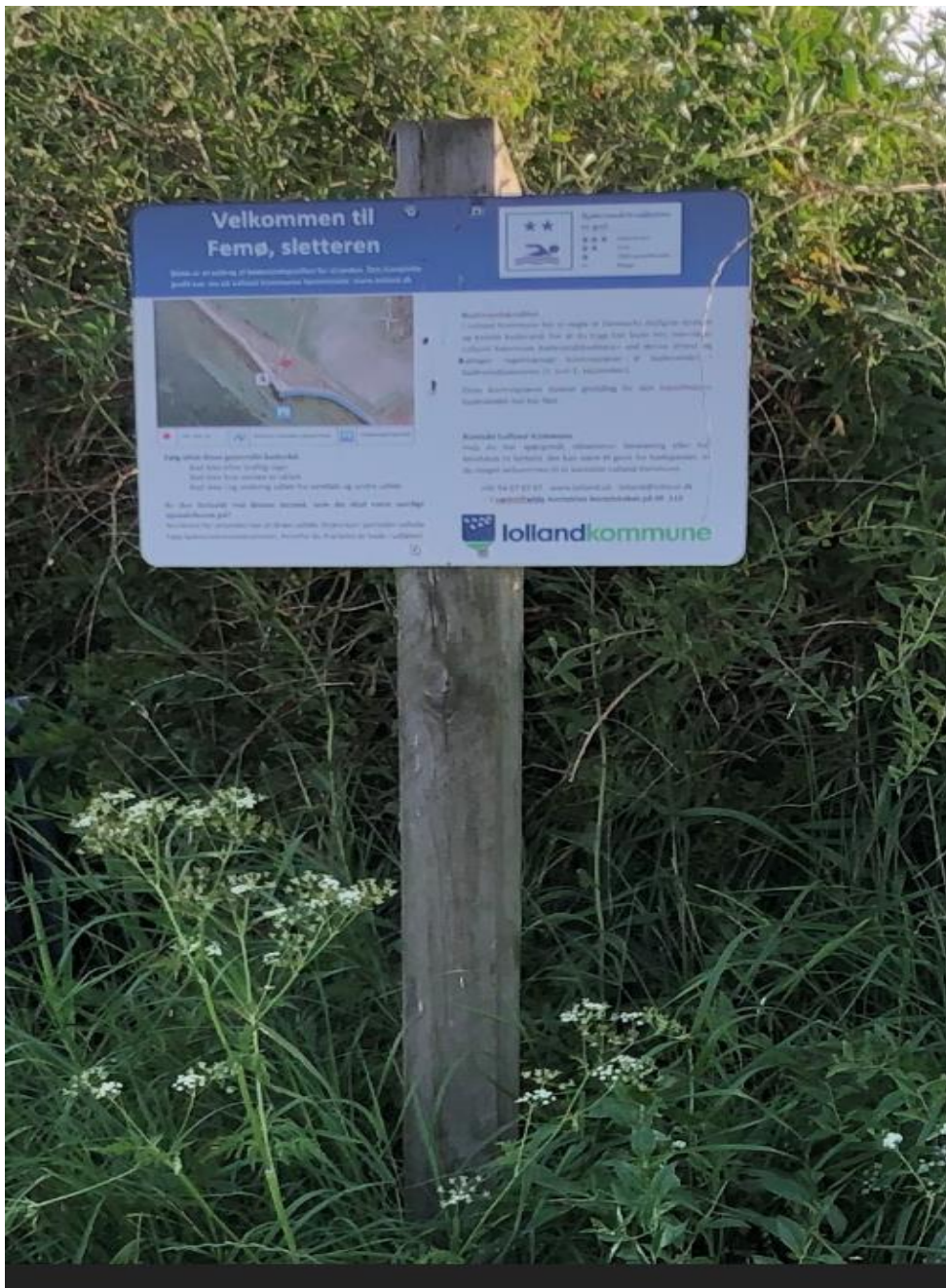
Fig. 2. Fremsendt billedet af eksisterende tavle og pæl, hvorpå fugletavlen påtænkes placeret