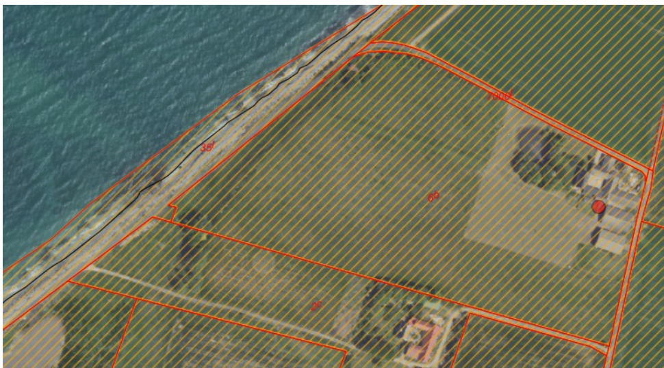
Fig. 3. Ortofoto 2020. Det orange skraverede område markerer det strandbeskyttede areal. De røde streger markerer de vejledende matrikelskel.

Ejendommen er i sin helhed beliggende i strandbeskyttelseslinjen. Se figur 3.