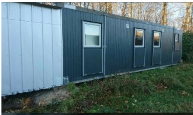
Figur 1. Foto fra ansøgningen, der viser eksempel på beboelsesvogn.

Der ansøges om midlertidig opstilling af beboelsesvogn i forbindelse med at ejendommens stuehus skal renoveres indvendigt. Se figur 1.