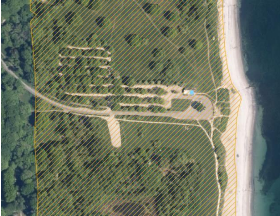
Fig. 1. Ortofoto 2020. Det orange skraverede område markerer det strandbeskyttede areal. Hjertestarterens placering er markeret ved blå punkt.

I har anmodet om dispensation fra strandbeskyttelseslinjen til opsætning af en hjertestarter ved Moesgaard strand. Placeringen er argumenteret med et højt publikumstryk og et generelt ønske om at forbedre sikkerheden.