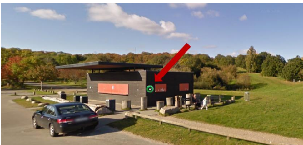
Fig. 2. Fremsendt billedet til illustration af hjertestarterens placering på eksisterende kiosk.

Hjertestarteren ønskes placeret på eksisterende anlæg (kiosk), se fig. 2.