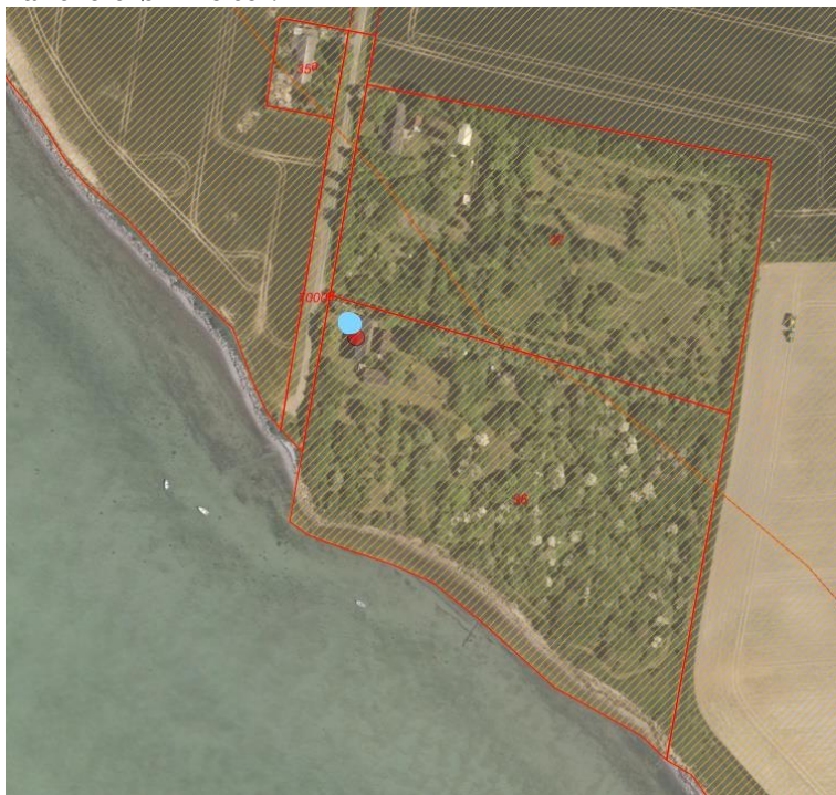
Fig. 1. Ortofoto 2021. Det orange skraverede område markerer det strandbeskyttede areal. De røde streger markerer de vejledende matrikelskel. Blå prik viser placeringen af minirensesanlæg.

Du ønsker at etablere et minirensesanlæg, som erstatning for en gammel septiktank, idet du oplyser, at den eksisterende septiktank med jævne mellemrum har oversvømmelser.