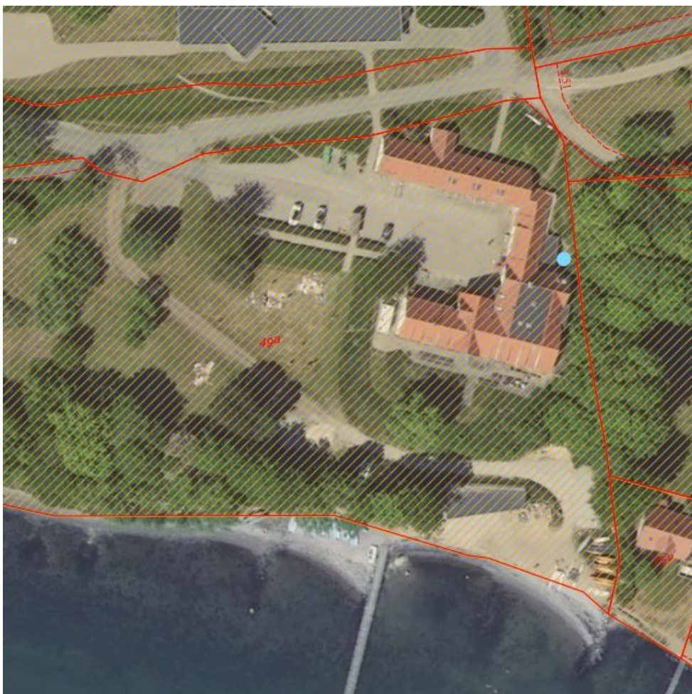
Fig. 1. Ortofoto 2020. Matrikellinjer markeret med rødt og ønsket placering af anlæg med blå. Skraveringen viser område med strandbeskyttelse.

I oplyser, at der ønskes monteret en luft/vand varmepumpe bag efterskolens hovedbygningen. Placeringen af anlægget er vist med blå markering på nedenstående billede.