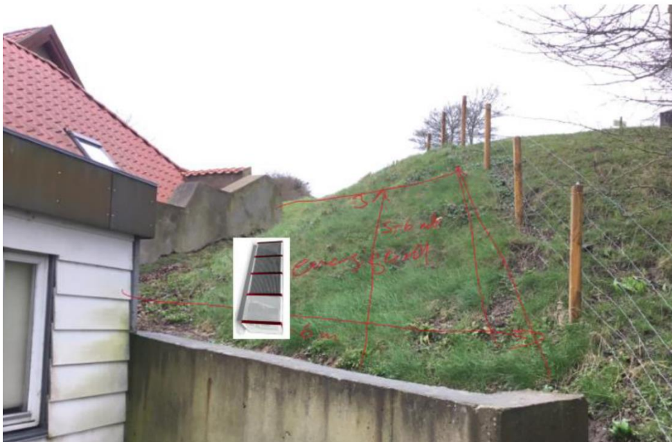
Fig. 3. Fremsendt billedet til af området, der ønskes planeret til brug for etablering af anlægget

Luft/vand varmepumpen ønskes placeret 75 cm fra nuværende betonvæg, som ses på fremsendt billedet, jf. figur 3. Det er oplyst, at der skal planeres et område på ca. 2 meter i bredde fra nuværende betonvæg og 4 meter i dybden for at kunne lave soklen, hvilket giver ca. 10 m 3 jord, som vil blive flyttet og lagt op bagved og jævnet pænt ud, så det passer med nuværende terræn.