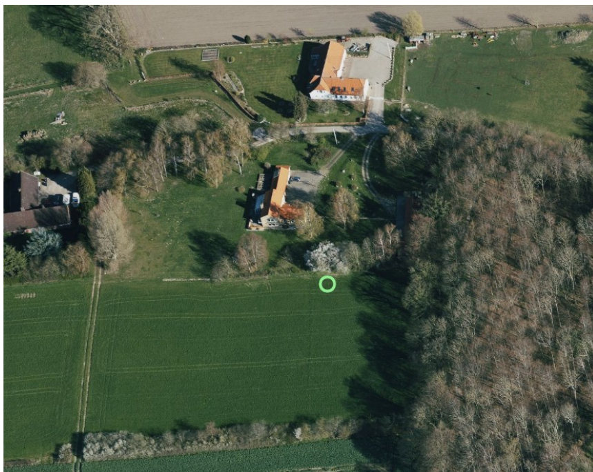
Opstilling ved grøn markering