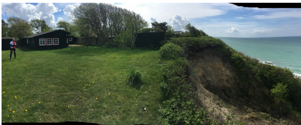
Figur 2. Foto fra ansøgningen viser skrænten til højre i billedet.

Det fremgår af sagens oplysninger, at skrænten eroderer oppefra pga. vand fra kilder, og at der regelmæssigt sker mindre skred i skrænten. Der ansøges om dispensation til påfyldning af materialer, der i type og volumen svarer til det som eroderer, i forventning om at det kan stabilisere skrænten. Påfyldningen vil ske på skræntens øvre del. Påfyldningen ønskes evt. gentaget på et senere tidspunkt, såfremt der er behov. Ifølge ansøger er princippet bag opfyldningen det samme som ved sandfodring. Et foto fra lokaliteten ses i figur 2.