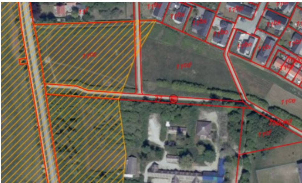
Figur 1. Ortofoto 2020. Det orange skraverede område markerer det strandbeskyttede areal. De røde streger markerer de vejledende matrikelskel.