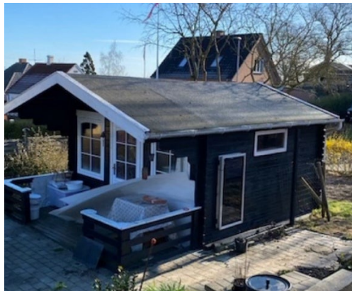
Fra ansøgningsmaterialet. Hytte der ønskes opstillet på plads nr. 47 (tv). Træhytte ved H4 (th).