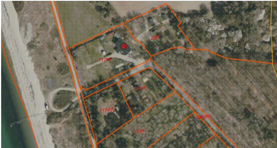
Fig. 1. Ortofoto 2025. Det strandbeskyttede areal er markeret med orange signatur. De røde streger markerer de vejledende matrikelskel.

Der ansøges om dispensation til etablering af: