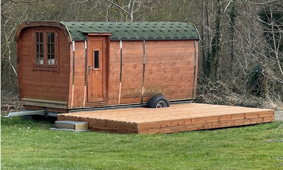
Fra ansøgningsmaterialet. Hytte 3.

"Ved hytte 3 som er flytbar og på hjul (15 m 2 ) er der etableret en flytbar terrasse uden gelænder. Campinghytterne er fint indpasset i terrænet og omgivelserne, og fremstår ikke meget synlige i landskabet."