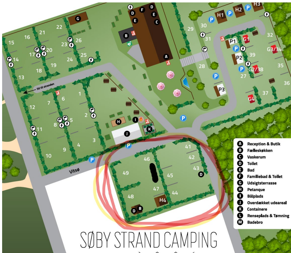
Fra ansøgningsmaterialet. Oversigtskort.