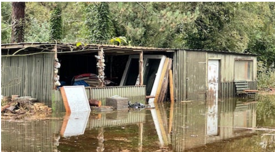
Fra ansøgningsmaterialet. Eksisterende bygning efter stormflod.

”Vores bygning (til maskiner og ophold af teltgæster gik til under stormfloden og ønskes genopbygget efter samme mål og materiale. Dog ønsker vi en anden facon på vinduerne. De kan ses på billedet hvor de står inde i skuret. 1 vindue mod vejen og 2 vinduer mod teltpladsen. Ingen af vinduerne eller bygningen kan ses fra vandet da bygningen er gemt af træer.”