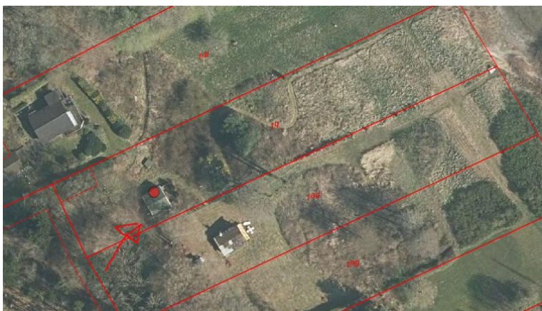
Sommerhuset – rød pil